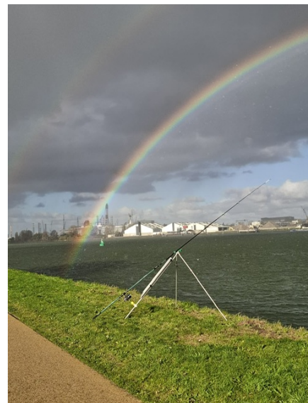
Nog een buitje met de regenboog.