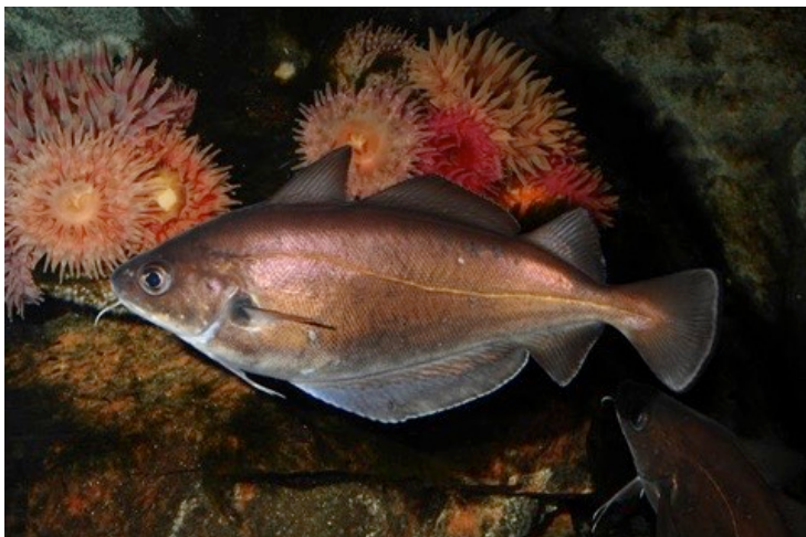
Er werden ook nog mooie Steenbolken gevangen