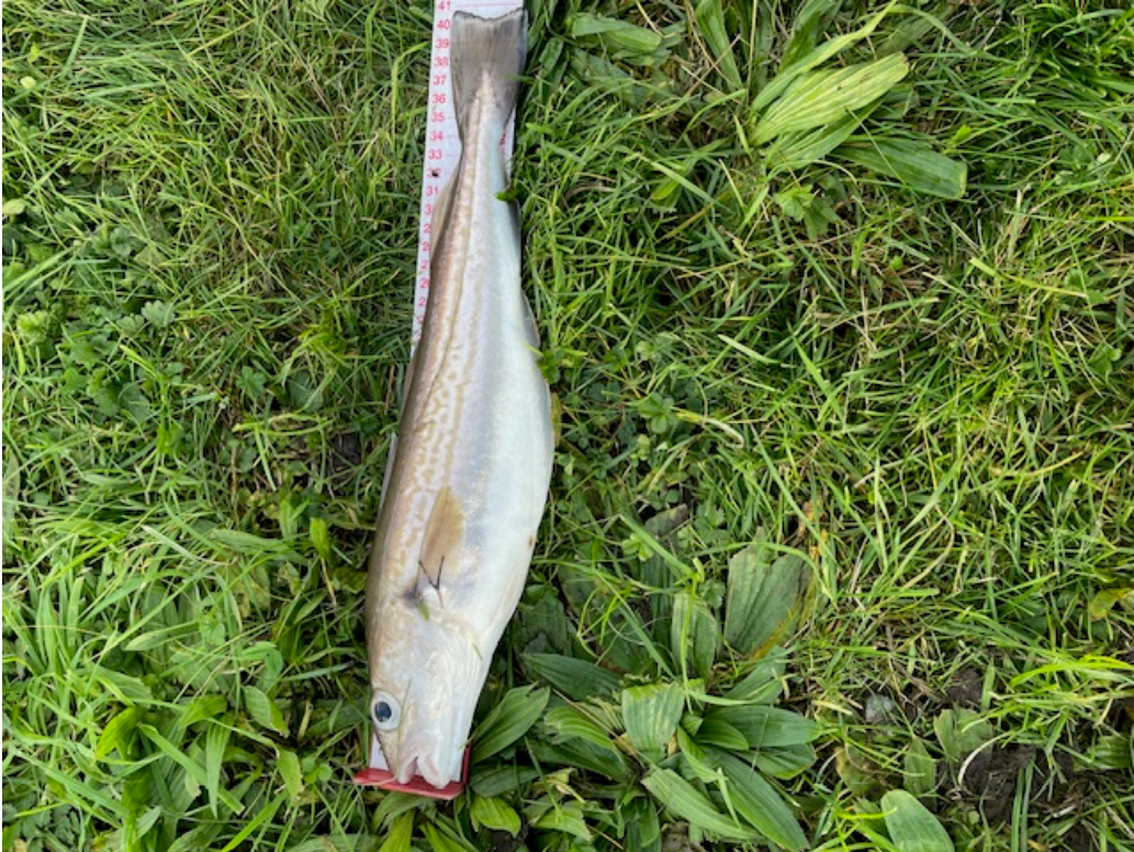
Veel wijting met als uitschieter een van 41 cm Kanjerpot !