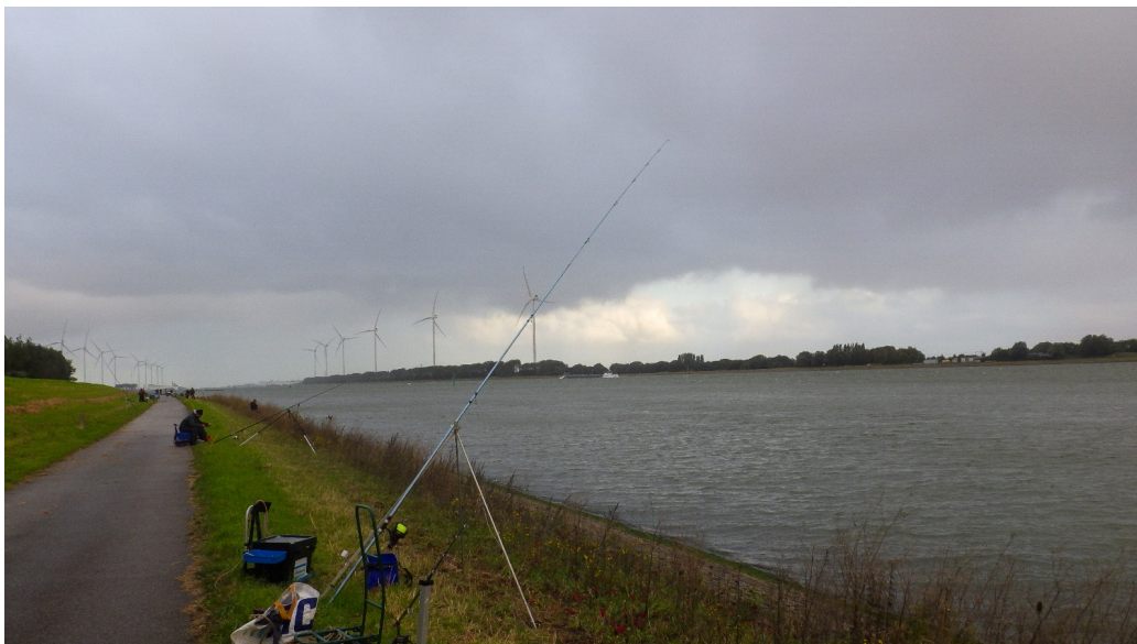
Waar het allemaal moest gebeuren vandaag Waterweg .

Hallo Visvrienden, Deze keer is een keer niet op het strand ,maar de uitgestelde tweekamp tegen de Slufter. Zou eerst Dintelhaven zijn maar werd uiteindelijk de Waterweg, ook weer is leuk, lang geleden dat ik op dat stuk gevestigd had. Ff een bakkie in de keet van de Slufter, iedereen voorzien van een nummertje en hop naar de slootkant. Het weer was wel een dingetje vooral in de ochtend een paar pittige buien en ook het windje had er zin in ,maar al met al was het wel te doen. Was wel een aardig stukje wandelen, zeker de lagere nummers dus hier en daar was wel een diepe zucht te horen, wat zijn wij dus bevoorrecht met onze trekkers. Had vandaag nummertje 22 geloot en in tegenstelling tot mijn burens gingen ik het met nylon proberen ipv van touw, nou ben ik daar al niet echt een voorstander van (van touw dan) en achteraf bleek het een goede keuze. De eerste 2 draaien kwam er behalve mijn buurman 2 plaatsen naar links niks mee, maar daarna kwam er iedere draai , op 1 na wel een visje mee. Geankerd of ongeankerd maakte geen verschil ,bleef prima liggen, Voornamelijk gevestigd met redelijk lange zijlijnen , voor mij werkte dat prima deze dag, als aas, zoals altijd piertje, slijkje en zo vier uurtjes met prima vermaak. 27 oktober vissen we een koppel wedstrijd en zoals het er nu naar uitziet is er een leuke opkomst, hopen op een beetje lekker weer en wat meewerkende visje en dan maken we er weer een mooie dag van. Groetjes Mischa