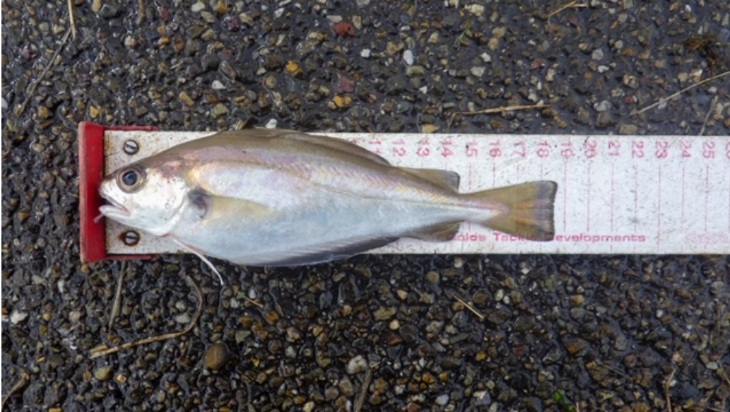
Heel veel Steenbolken vandaag !