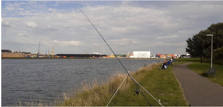
Plaats delict zaterdagavond Pernis !