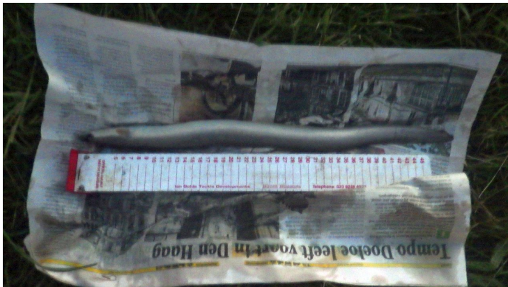
Ook een paar Palingen kwamen zich melden .