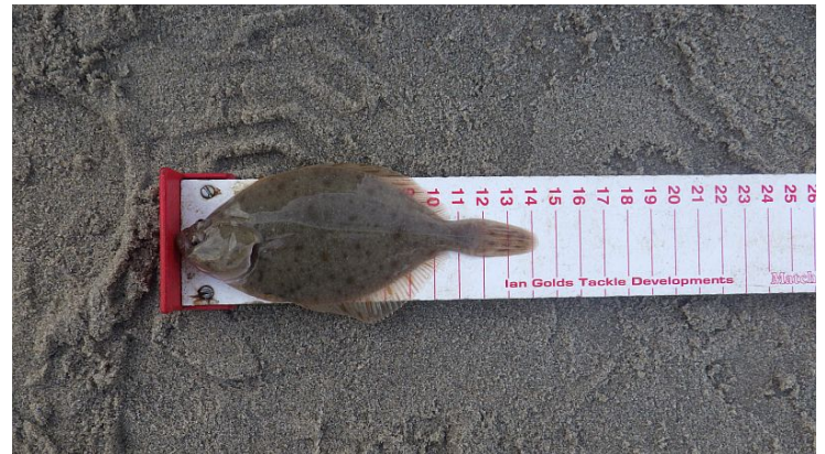
En uiteraard de nodige Botten .